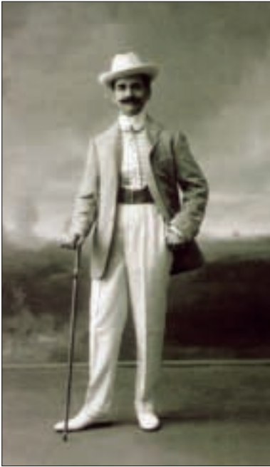
Raymond Roussel: Schriftsteller, Dandy, Schachspieler, Pistolenchampion und Millionär.