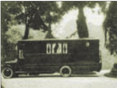
Roussel en route...